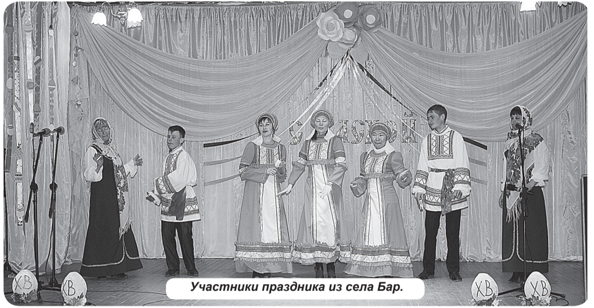
Участники праздника из села Бар.

показать, на что они способны, как могут организовать торжество. Программа праздника по сравнению с прошлыми мероприятиями такого рода была обновлена – в этот раз организаторы решили привлечь к участию молодежь и придумали для нее интересные состязания. В конкурсе «Пасхальным небом освящен мой дом!» выступали молодежные команды Барского, Шаралдайского, Подлопатинского, Калиновского, Харашибирского и Тугнуйского сельских поселений. Все они удивили зрителей своими артистическими и музыкальными способностями. Порадовало то, что во время своих выступлений артисты выстраивали общение со зрителями, выходили в зал. Лучшими были признаны молодые люди из Бара и Харашибиря.